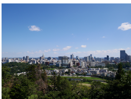
仙台城址からの眺め

会場から 1Km、15 分の徒歩で仙台城址に行けます。仙台の街の眺めがとってもきれいです。2 時間ドラマでよく出演する伊達政宗にも会えますよ。